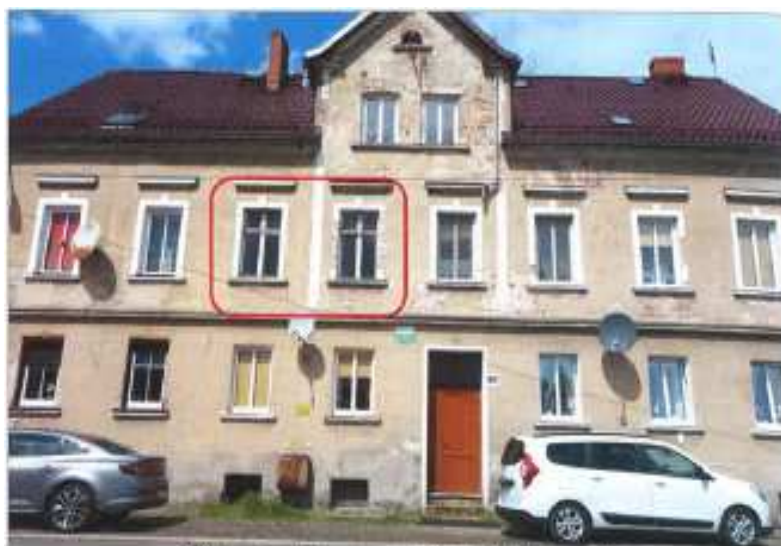
Widok elewacji frontowej – ul. Starolubańska nr 10A.

na sprzedaż lokalu mieszkalnego Nr 6, znajdującego się w budynku położonym w Lubaniu przy ul. Starolubańskiej 10a wraz z udziałem we współwłasności nieruchomości gruntowej (działka nr 25/1, AM 20, Obręb II o powierzchni 896 m 2 , JG1L/00018124/4)